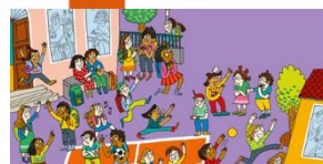
Illustration : Adrienne Barman, tiré de « Le ballon de Manon et la corde à sauter de Noé », Ed. Le deuxième Observatoire, 2018